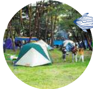
大洗キャンプ場 TEL.029-267-2276 〒311-1301 大洗町磯浜町 8231-4