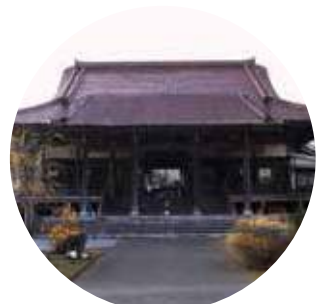
願入寺 TEL.029-266-2334 〒311-1301 大洗町磯浜町 7920