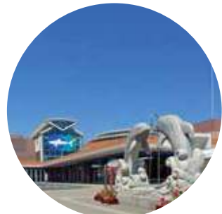
アクアワールド茨城県大洗水族館 TEL.029-267-5151 〒311-1301 大洗町磯浜町 8252-3